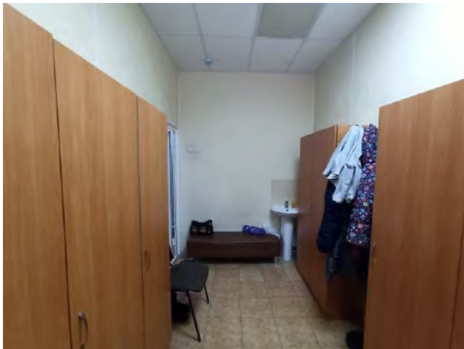
Раздевалка (помещение № 11)