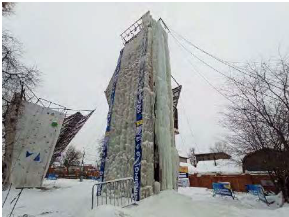
Скалодром с функцией ледодрома